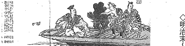
新春を祝う句が載った春興大刷物(1906年、雪中庵作成)